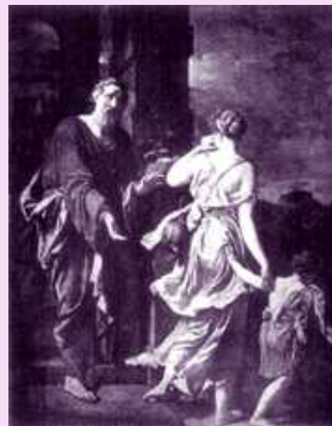
Abraham, Agar, e Ismael

No es casual que en el resto del texto bíblico no aparezca la figura de Abraham. Así como él desapareció para su familia despedida, también lo ha sido de los ojos de los lectores. Agar e Ismael se convierten a partir de ese momento en los protagonistas de esta historia. La salvación, el crecimiento y las promesas de vida (v.17.19.20) acontecen, lamentablemente, en un mundo sin padres. ¿Cuánto perdieron Agar e Ismael con la ausencia de Abraham? ¿Cuánto perdió Abraham con la pérdida de esta mujer y su hijo?