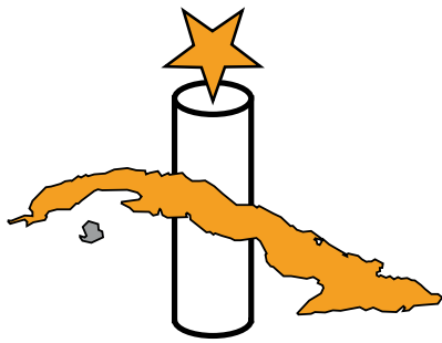
Plataforma Pastoral Cubana